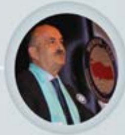
Dr. Mehmet MÜEZZİNOĞLU T.C. Sağlık Bakanı

Başbakanımız Recep Tayyip Erdoğan, Genel Başkanımızın yıpranma payı talebine cevaben; "Sizler umudun adısınız... İşte onun için her birinizden Allah razı olsun diyor, hepinize teşekkür ediyorum. İnsan hayatı için, hayat kurtarmak için mücadele eden, her kim varsa, kutsal bir görevi ifa ediyor. Ne büyük zorluklar yaşadığınızı çok iyi biliyoruz. Az önce Sayın Başkan ifade etti yıpranma payı ile ilgili. Yıpranma payını ne kadara ne kadar vereceğiz. Sorduk. 5 yıla 1 yıl. Ben de talimatı vereceğim 5 yıl hizmeti olanın 1 yıl yıpranma payı olacak" dedi.