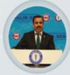
Metin MEMİŞ Sağlık-Sen Genel Başkanı