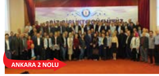
ANKARA 2 NOLU