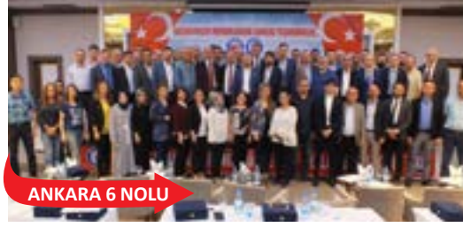
ANKARA 6 NOLU