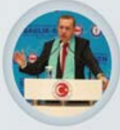
Recep Tayyip ERDOĞAN T.C. Başbakanı