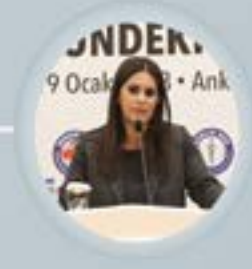
Jülide SARIEROĞLU T.C. Çalışma ve Sosyal Güvenlik Bakanı

Çalışma ve Sosyal Güvenlik Bakanı Jülide Sarıeroğlu; Cumhurbaşkanımızın ağızından söz bir kere çıkar ve gereği her zaman yapılmıştır. Yıpranma payı konusunda da atılması gereken adımlar atılacaktır. İnşallah en kısa sürede çalışmalar nihayete erdirilir" dedi.