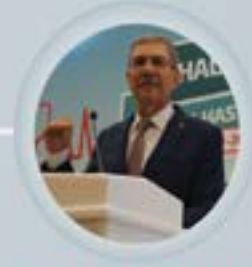
Dr. Ahmet DEMİRCAN T.C. Sağlık Bakanı

Sağlık Bakanı Ahmet Demircan; "Sağlık çalışanları ile ilgili önümüzdeki günlerde sizlerle paylaşacağımız düzenlemeler yapacağız" dedi