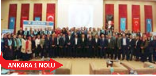
ANKARA 1 NOLU