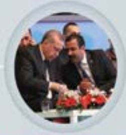
Sağlık-Sen Genel Başkanı Metin MEMİŞ ve T.C. Cumhurbaşkanı Recep Tayyip ERDOĞAN'ın görüşmeleri