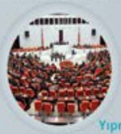
Yıpranma Payı Talebimizi TBMM'deki Görüşmelerde de Takip Ettik