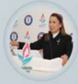
Öznur ÇALIK AK Parti Genel Başkan Yardımcısı

AK Parti Genel Başkan Yardımcısı Öznur Çalık; "Sayın Cumhurbaşkanımızın talimatları, Başbakanımızın yakın takipleri ve Sağlık Bakanlığımızın da çok yakından incelemesi, irdelemesi izlemesi ve gereğini yerine getirmesi ile sağlıktaki yıpranma payımız Meclis'e geliyor" dedi.